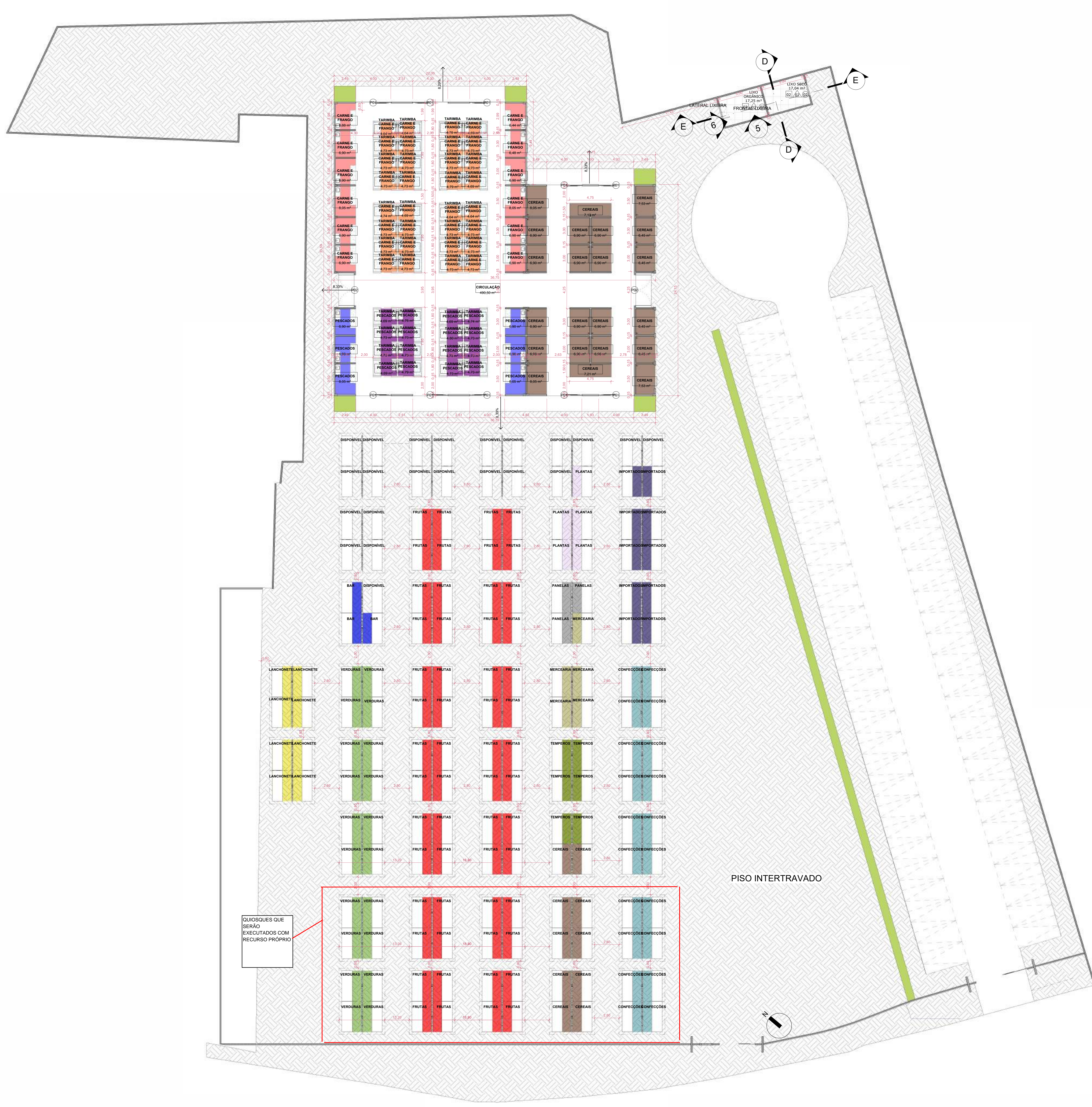
PLANTA BAIXA PAV TÉRREO ESCALA 1:175